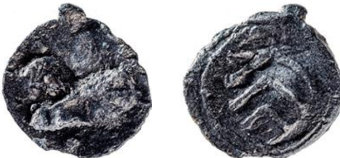
Scharnierzegel met dubbele vergrendeling; Lier (?), 15e eeuw, Ø 21mm Voorzijde grotendeels uitgekomen. Kz: wapenschild met drie kepers

De oudste relatief zeker dateerbare scharnierzegels zijn relatief klein. Exemplaren uit Vlaamse centra zoals Ieper en Damme hebben op het einde van de 14e eeuw meestal een diameter die schommelt tussen 1 en 1,5 cm. Tweepuntzegels van bijv. Mechelen hebben in dezelfde periode een vergelijkbare doormeter. Wat oudere scharnierzegels met centrale beveiliging uit Tongeren zijn wat groter en hebben een doormeter van ongeveer 2 cm. In de loop van de 15e eeuw worden de scharnierzegels stilaan groter en hebben ze meestal een doormeter van ca. 3 cm. Op het einde van de eeuw bereiken sommige exemplaren echter al een diameter van 5 cm. De grotere exemplaren hebben vaak, maar niet altijd, meer dan één vergrendelingspin.