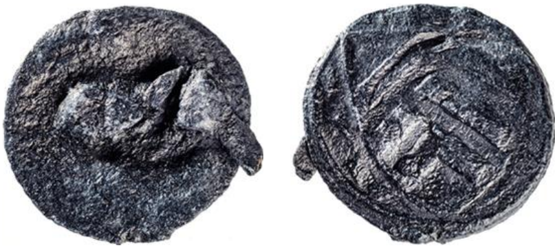
Scharnierzegel met dubbele vergrendeling; Lier(?), 15e eeuw, Ø 21mm, Voorzijde grotendeels uitgebroken, vervormd. De keerzijde toont het Lierse wapenschild met de drie kepers tussen twee ranken.

De elektronische beveiligingsmechanismen, die sinds enkele jaren door verschillende kledingketens in België, Nederland en elders gebruikt worden, knopen wat vorm betreft naadloos aan bij de middeleeuwse scharnierzegels.